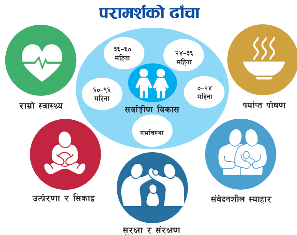
चित्र नं. १